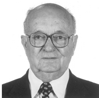
Figura 2 - José Antunes Rodrigues.

José Antunes Rodrigues (Figura 2) tem feito parte do conselho editorial dos seguintes periódicos: Molecular Psychiatry (1990-1996) e Brazilian Journal of Medical and Biological Research (desde 2006).